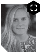
TEKST / KATRINE MUNCH VOLLESEN